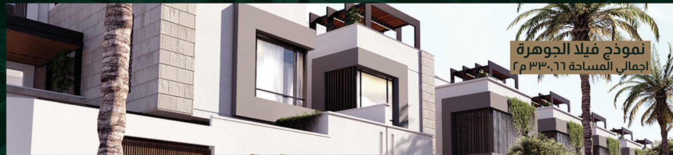
نموذج فيلا الجوهرة إجمالي المساحة ٣٣٠,٦٦ م ٢