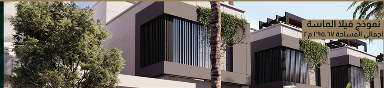
نموذج فيلا الماسة إجمالي المساحة ٢٩٥,٦٧ م